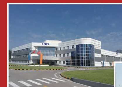
北京阿奇夏米尔工业电子有限公司

未来，GF加工方案将更多的瑞士进口机床引入中国生产，将中国工厂打造成全球生产基地，让“瑞士品质、中国制造”的机床扎根中国、服务全球。