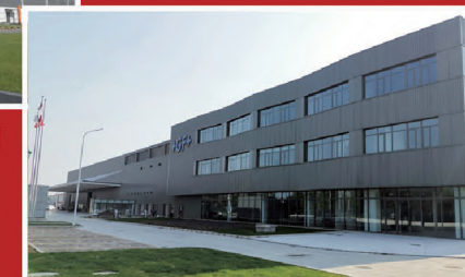
乔治费歇尔机床（常州）有限公司工厂